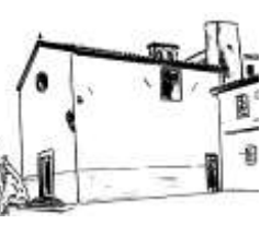
S. Elena in S. Elena

L'evento che illumina i nostri volti nel giorno della Risurrezione