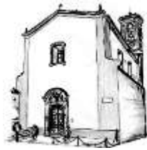
S. Maria Assunta in Cerqueto

Archidiocesi di Perugia - Città della Pieve Unità Pastorale 26