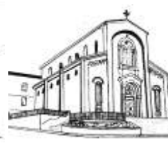
S. Maria e S. Michele Arcangelo in Papiano