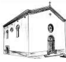
S. Cristoforo in Compignano